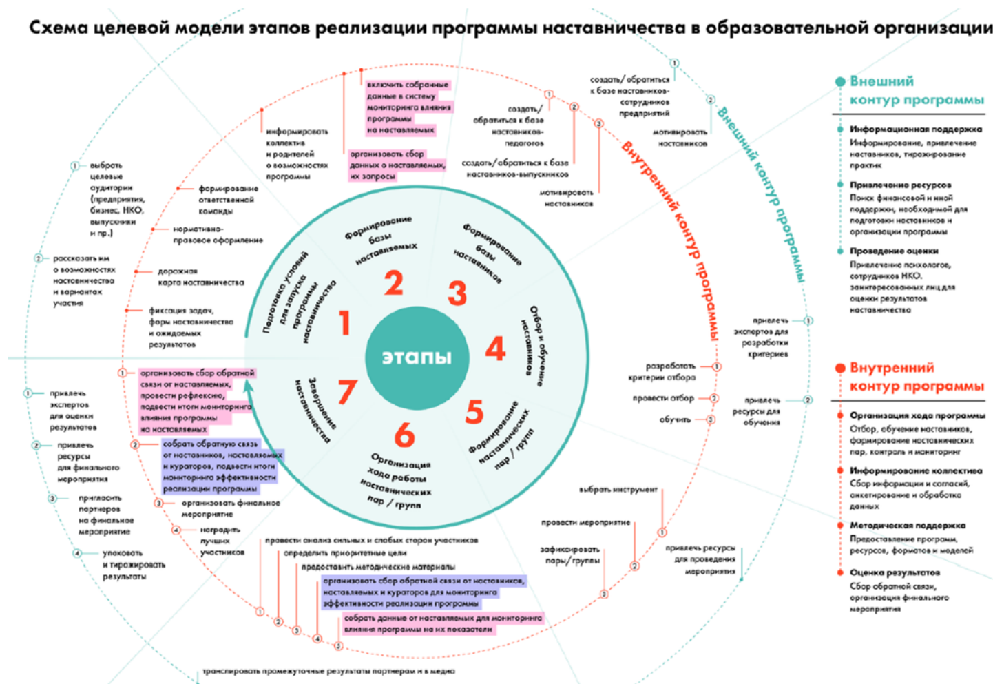
Схема целевой модели этапов реализации программы наставничества в образовательной организации